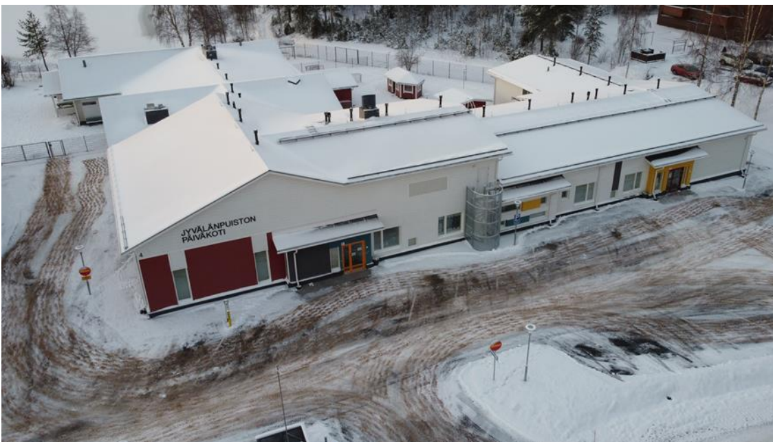
Kuva: Valmistunut Jyväskylänpuiston päiväkotihanke

Jyväskylänpuiston päiväkodin laajennushanke luovutettiin käyttäjille loppukesästä 2020. Investointiin liittyi pääurakoitsijan ajautuminen konkurssimenettelyyn keväällä. Työ saatettiin loppuun Kemijärven Roikka Oy:n taholta.