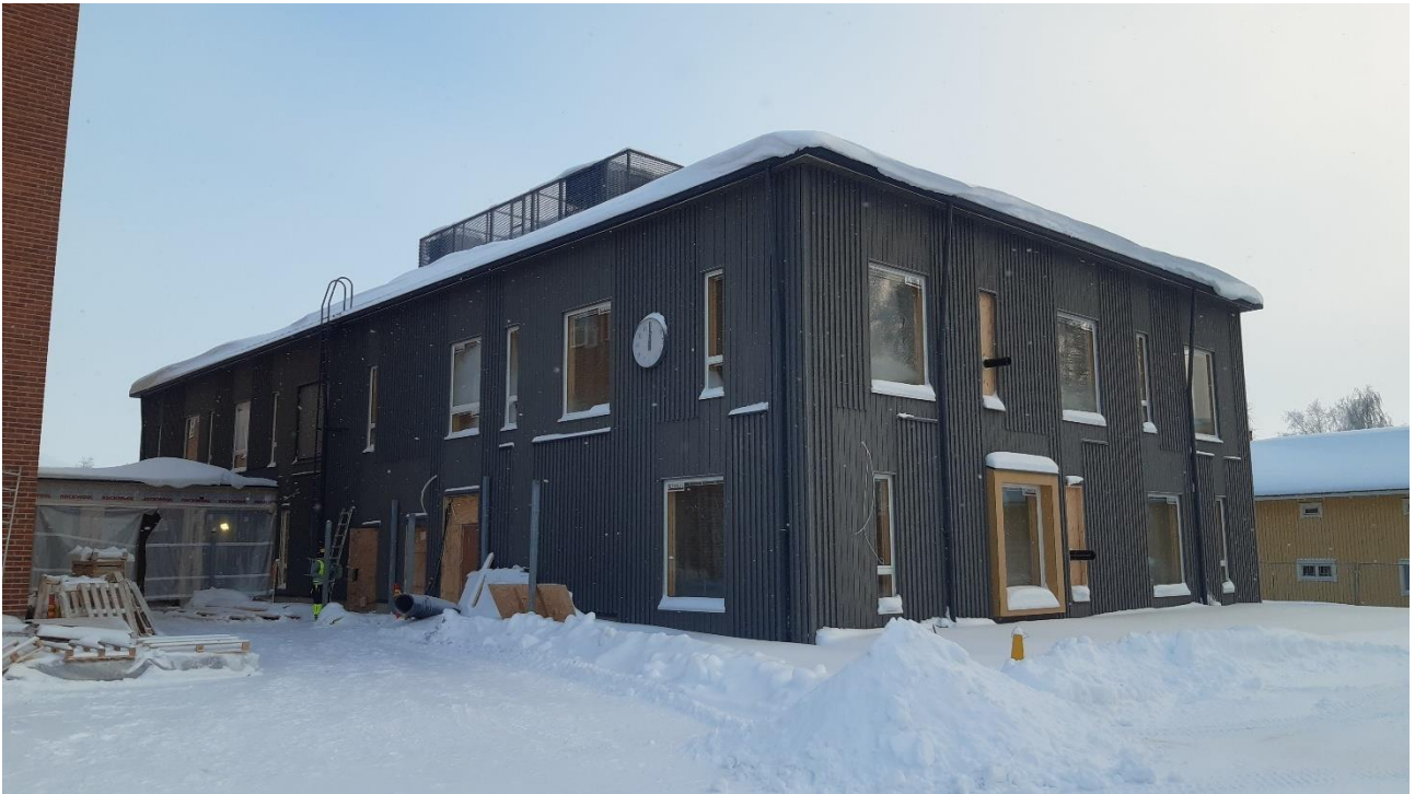
Kuva: Valmistuva Hillatien koulukampuksen lisärakennus

Jyväskylänpuiston päiväkodin laajennushanke luovutettiin käyttäjille loppukesästä 2020. Investointiin liittyi pääurakoitsijan ajautuminen konkurssimenettelyyn keväällä. Työ saatettiin loppuun Kemijärven Roikka Oy:n taholta.