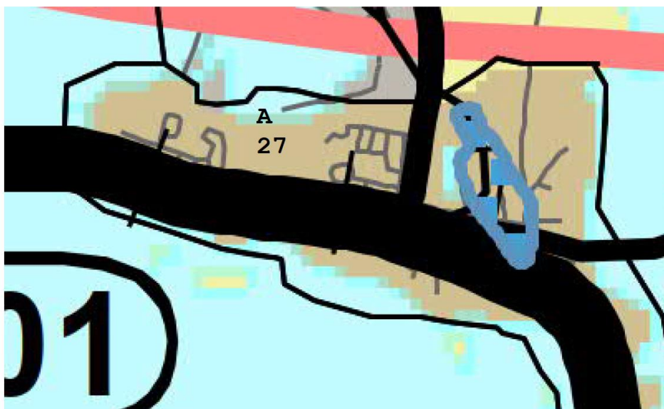
Kuva 2. Voimassa oleva maakuntakaava.

Maakuntakaavan tarkistus on meneillään, muutoksia suunnittelualueelle ei ole tulossa.