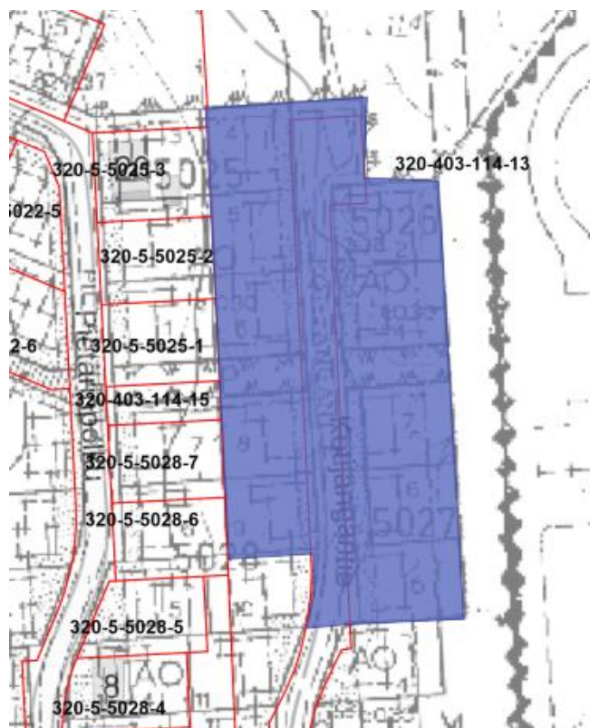
Kuva 3. Ajantasa-asekaava