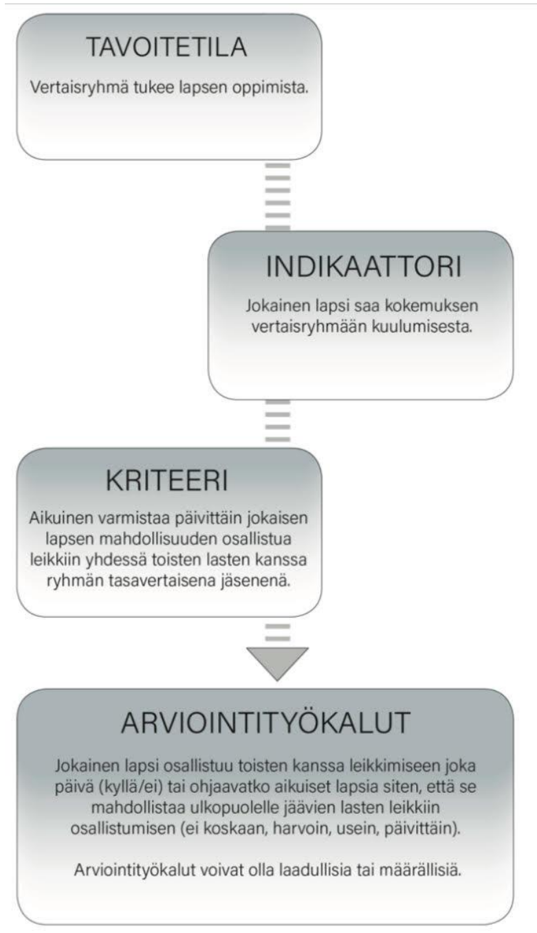
Kuvio 1. Esimerkki systemaattisen arvioinnin etenemisestä

Varhaiskasvatuksessa arvioidaan henkilöstön toimintaa ja lapsen kohtaamaa varhaiskasvatuksen laatua. Tavoitteita kuvaillaan tarkemmin indikaattorien eli laatua kuvaavien ominaisuuksien avulla. Indikaattorit konkretisoivat tavoitteet arvioivaan muotoon. Arviointitiedon keräämiseksi indikaattorit käsitteellistetään kriteereiksi eli arviointiperusteiksi. Nämä ovat käytäntöä kuvailevia väittämiä tai kysymyksiä. Kriteerien määrittelyn pohjalta kootaan arviointityökaluja, jonka avulla varsinainen arviointi toteutetaan. Menetelminä voivat olla esimerkiksi kyselyt, systemaattinen havainnointi tai pedagogiseen dokumentointiin liittyvät prosessit.