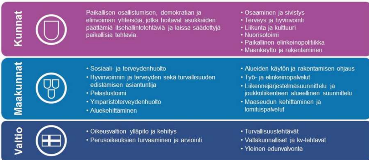
Kuvio 3. Työnjako kunta-maakunta-valtio

Saura-säätiö tuottaa kaupungille kumppanuus- ja palvelusopimuksen mukaisesti pääsääntöisesti kuntouttavaa toimintaa. Parhailtaan on käynnissä sosiaalihuollon työllistymistä tukevan toiminnan ja työtoiminnan lainsäädännön ja palvelujärjestelmän uudistus. Mikäli laki hyväksytään, niin kuntouttava työtoiminta jakaantuu kahtia ja maakunta järjestää ja hankkii 1) sote-palveluiden kautta sosiaalista kuntoutusta ja 2) kasvupalveluiden kautta työllistymistä edistävää kuntoutusta. Sosiaalisen kuntoutuksen palvelut tuotettaisiin asiakassetelin kautta.