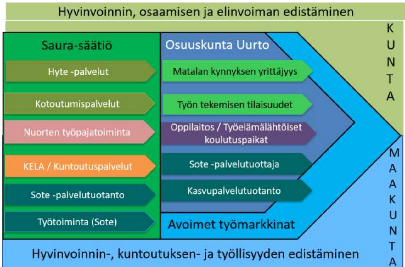
Kuvio 4. Visio Saura-säätiön ja Osuuskunta Uurton palveluista 2025

Säätiön strategian laadinta edellyttää kaupungin strategisia linjauksia työhön kuntoutuksen ja työllisyyden edistämisen palvelukokonaisuudesta. Nykyiset palvelut tuotetaan hajautetulla mallilla, jossa on päällekkäisiä toimijoita ja palveluita. Vuonna 2019 kaupungin työllisyysyksikön asiakasmäärä tulee vähenemään noin 100 työttömällä, kun alueellinen työllisyyskokeilu -hanke on näillä näkymin päättymässä vuoden vaihteessa. Vähentyvien palvelutarvitsijoiden johdosta säätiön ei ole jatkossa enää järkevää tuottaa ja resursoida tiloja ja henkilöstöä sopimuksen mukaisesti sekä samanaikaisesti kilpailla asiakkaista kaupungin päällekkäisiä palveluita tuottavien yksikköjen kanssa. Toisaalta säätiötä ei voida ylläpitää pääosin hanke- ja avustusrahoituksen turvin, mikäli säätiön sääntöjen määrittelemälle tarkoitukselle ei ole enää kaupungin sisällä tarvetta eli säätiön perustehtävä hoidetaan jatkossa kaupungin sisäisin palveluin.