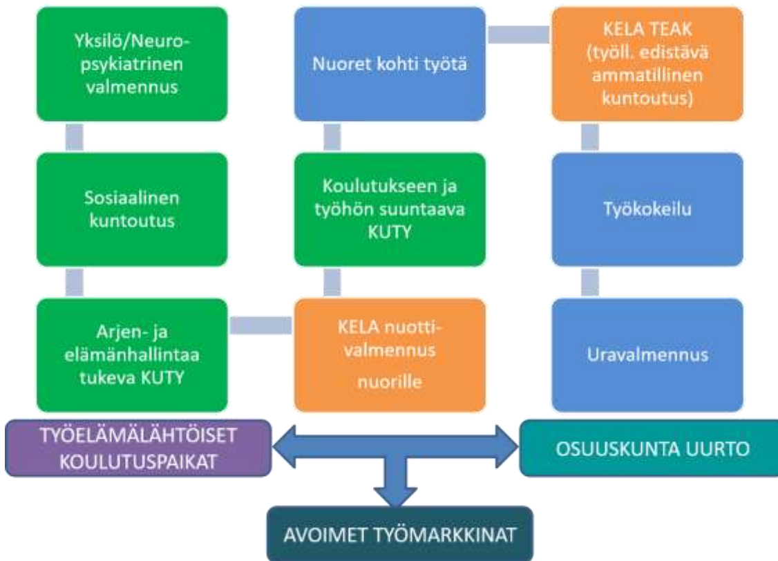
Kuvio 1. Saura-säätiön palvelukokonaisuus

Saura-säätiön palveluiden kehittämisen keskiössä on asiakkaiden valinnanvapauden lisääminen. Asiakkaan toimijuuden vahvistamiseksi ja osallisuuden lisäämiseksi säätiö kehittää palveluitaan siten, että asiakkaalla on jatkossa entistä enemmän valinnanvapautta rakentaa oma palvelukokonaisuus. Säätiön palveluista on otettu vuoden 2018 alussa käyttöön palvelutarjotin (kuvio 2), josta asiakas voi oman palvelutarpeen pohjalta valita joko 1) hyvinvointia tukevia ja tai 2) työelämään valmentavia ja tai 3) koulutukseen suuntaavia ja tai 4) työllistymisen edistämisen palveluita, jotka muodostavat saumattoman palveluketjun.